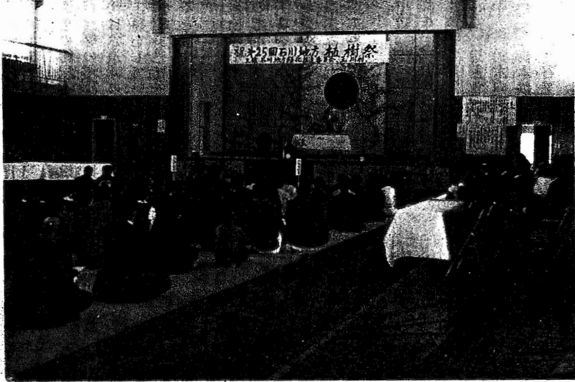
◎ 記念植樹のもよう ◎ 植樹祭の会場風景

の一環として、第二十五回石川地方植樹祭が須釜小学校を会場として、県知事はじめ多数の参加者により盛大に開催し学校緑化に努めました。