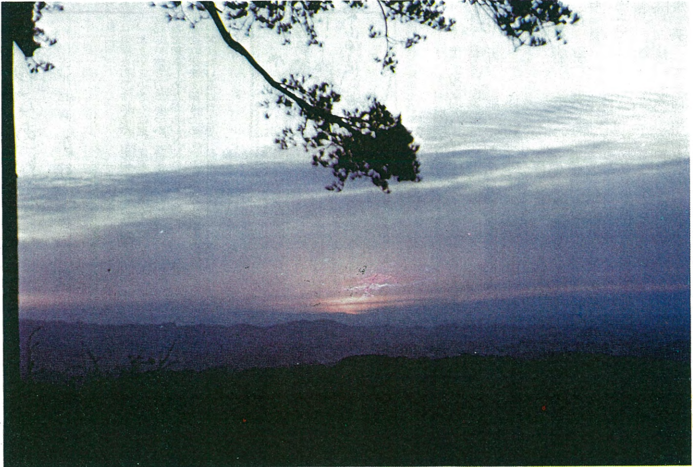
共同桑園より日の出を望む