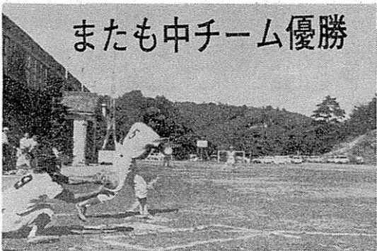
またも中チーム優勝