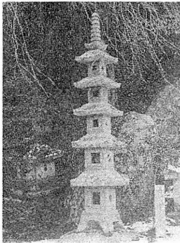
巳待、申待等は十二支の当り日を持って講をつくり、男