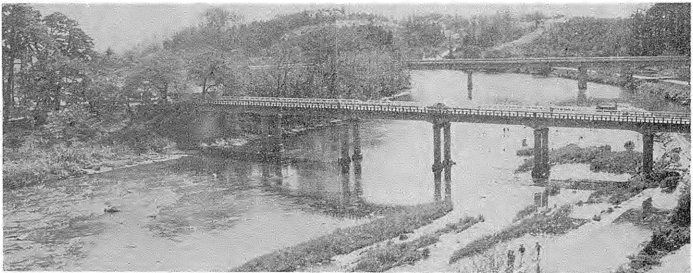
乙 字 橋