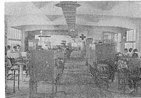
福島双羽電気株式会社

えません。各工場の発展は、村の開発につながり、地域住民の福祉の向上となっております。現在就職希望は都市部に集中しているようですが、村内工場は自