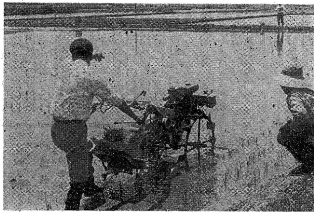
竜崎地内に於ける田植機の実演