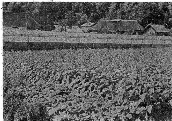
北須釜葉たばこ近代化経営農場