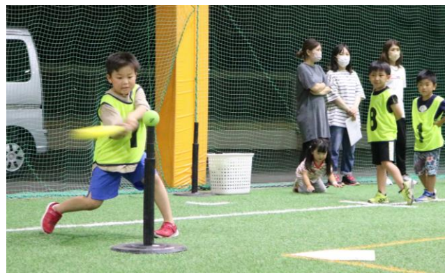
ホームランを目指してフルスイング！

ティーボールを楽しもう！ 6月16日より3回コースでティーボールスクールを開催し、小学生30名が参加しました。 最初は基本的な動きとして、ボールの投げ方や捕り方等ボールの扱い方を学び、講師から『相手が取れるように投げること』『投げる時も取る時も、しっかりとボールを見ることが』と指導を受けました。 バッティングでは、コツをつかんで上手くバットの芯に当てて外野奥まで飛ばせる子も多く、講師と見に来ていた保護者を驚かせました。 ※協力：玉川ソフトボールスポーツ少年団 ※この事業は福島県スポーツ振興基金を活用して開催しました