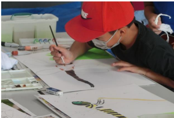
細かいところまでじっくり描こう

7月27日(水)、小学生向けアート教室を開催し、13名が参加しました。今回は『トンボ』をテーマに開催し、事前に図鑑で調べてきてた子や、より本物に近い絵を描くためにスタッフと一緒にタブレットで検索する子もいました。