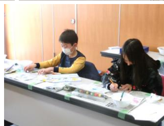
ステキな作品がたくさんできました☆