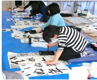
先生特製のお手本を見ながら書きました。

入退室自由の教室でしたが、粘り強く退室時間ギリギリまで書き上げたり、ほかの課題に挑戦する参加者の姿が見られました。