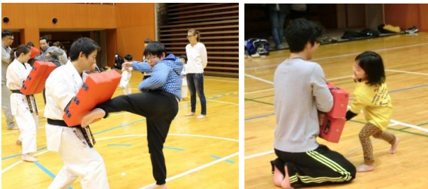
黒帯の師範からの直接指導!

1月19日(木)に、極真館玉川支部にご協力いただき、空手の打撃練習法『ミット打ち』に挑戦しました。空手初心者の親子から、試合経験のある上級者まで43名が参加し、構え方、拳の握り方、ミットへの当て方など、レベルに合わせた指導を受けました。約1時間のミットトレーニングで、終わるころには身も心もスッキリ、気持ちのいい汗を流しました。