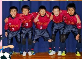
最後の大会でも得意のチームワークと粘りで頑張った6年生。