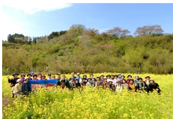
← 満開の菜の花に囲まれてパチリ

当日の花見山は天候に恵まれて、青空の下ウォーキングすることができました。暖冬で開花が早まった影響か、桜は早々に散ってしまったようですが、菜の花やキクモモが満開を迎えていたり、普段桜の季節には見れない珍しい品種の花にも出会え、参加者の目を楽しませていました。