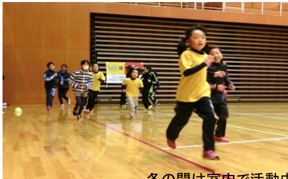
冬の間は室内で活動中です！

今年度は郡山市や鏡石町のマラソン大会にも出場し、それぞれ完走することはもちろん、自己タイムの更新を目標に頑張っています！