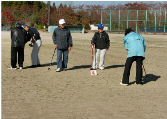
日によって変化する地面の状態をよく確かめて...