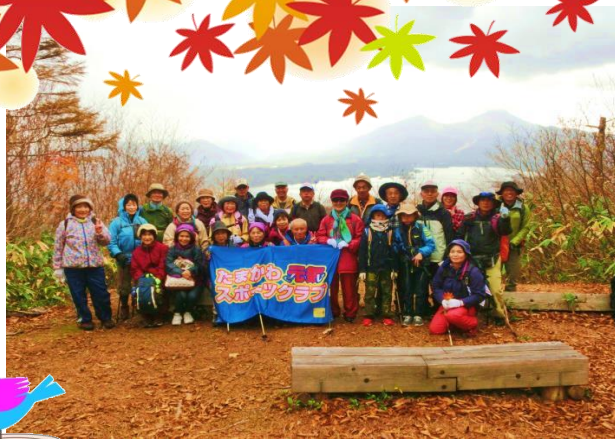
磐梯山をバックに記念撮影

晩秋の裏磐梯は紅葉も終盤を迎え、すでに冬の雰囲気がかたよっていました。さらに思いもよらぬ初雪に出くわして、裏磐梯の冬の厳しさを想像しながらのトレッキングとなりましたが、青空に映えるもみじや木の実を眺めたり、同行した『もりの案内人』から自生する植物や磐梯山の歴史についての解説を聞いたりと、参加者は自然と親しみながら知識を深めました。