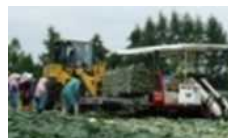
機械化体系の導入