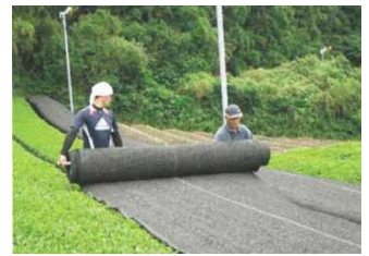
茶の被覆作業の実施