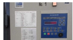
環境制御盤の導入