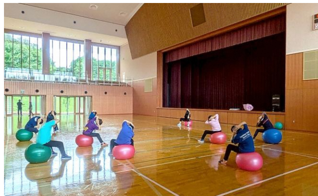
ここからだも前向きに★

仲間と一緒に「げんきUP！」 今年4月から開催していた中高年向けトレーニング教室「げんきUP教室」が、無事に全日程を終了しました。教室では、バランスボールやミニハードル、ラダーを使った筋力トレーニングを中心に、天気の良い日には屋外でウォーキングも取り入れられました。参加者同士の会話も自然と生まれ、毎回、笑顔あふれる雰囲気の中で実施することができました。運動だけでなく、仲間と交流する時間を大切にしながら取り組めたことも、この教室の大きな魅力です。「体が軽くなった」「家でも意識して体を動かすようになった」といった声も多く聞かれ、継続して運動することの大切さや効果を改めて感じる機会となりました。