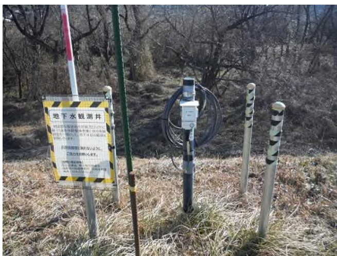
地下水位観測孔設置状況 (例)