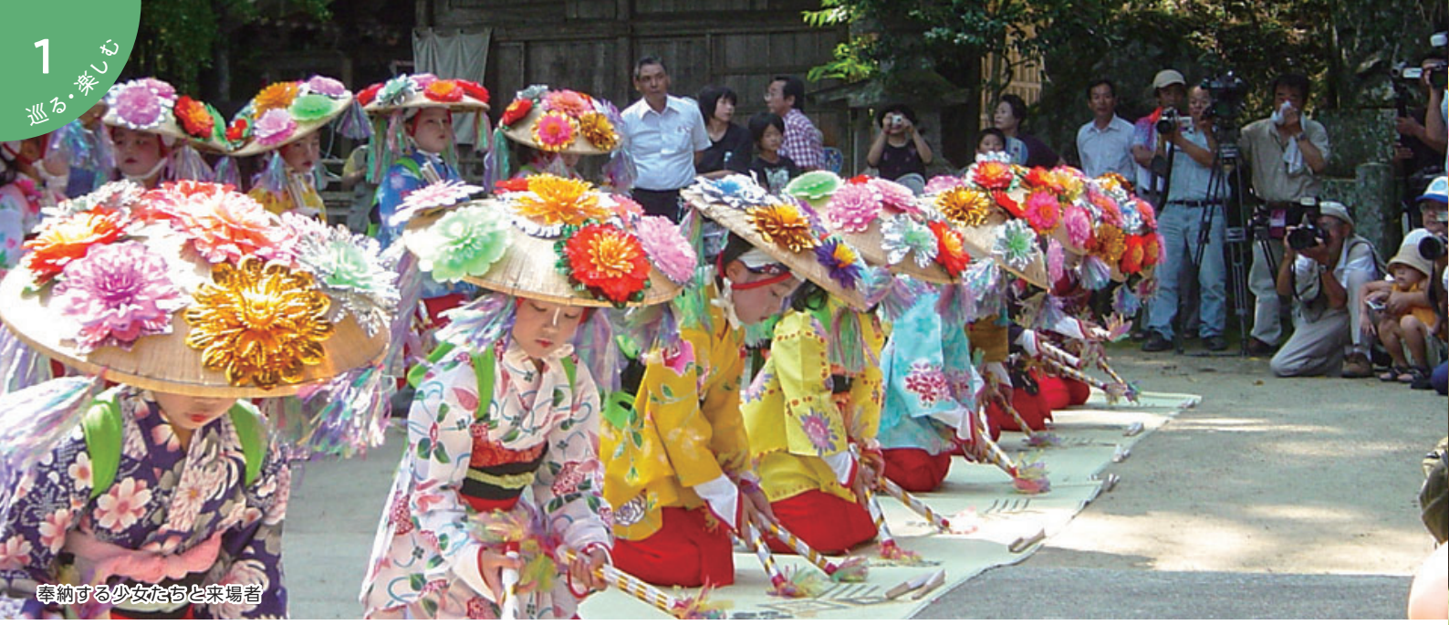
奉納する少女たちと来場者