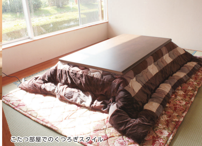
こたつ部屋でのくつろぎスタイル