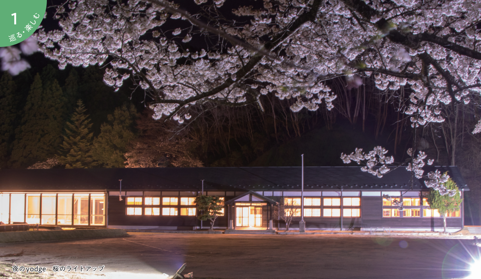
夜のyodge 桜のライトアップ