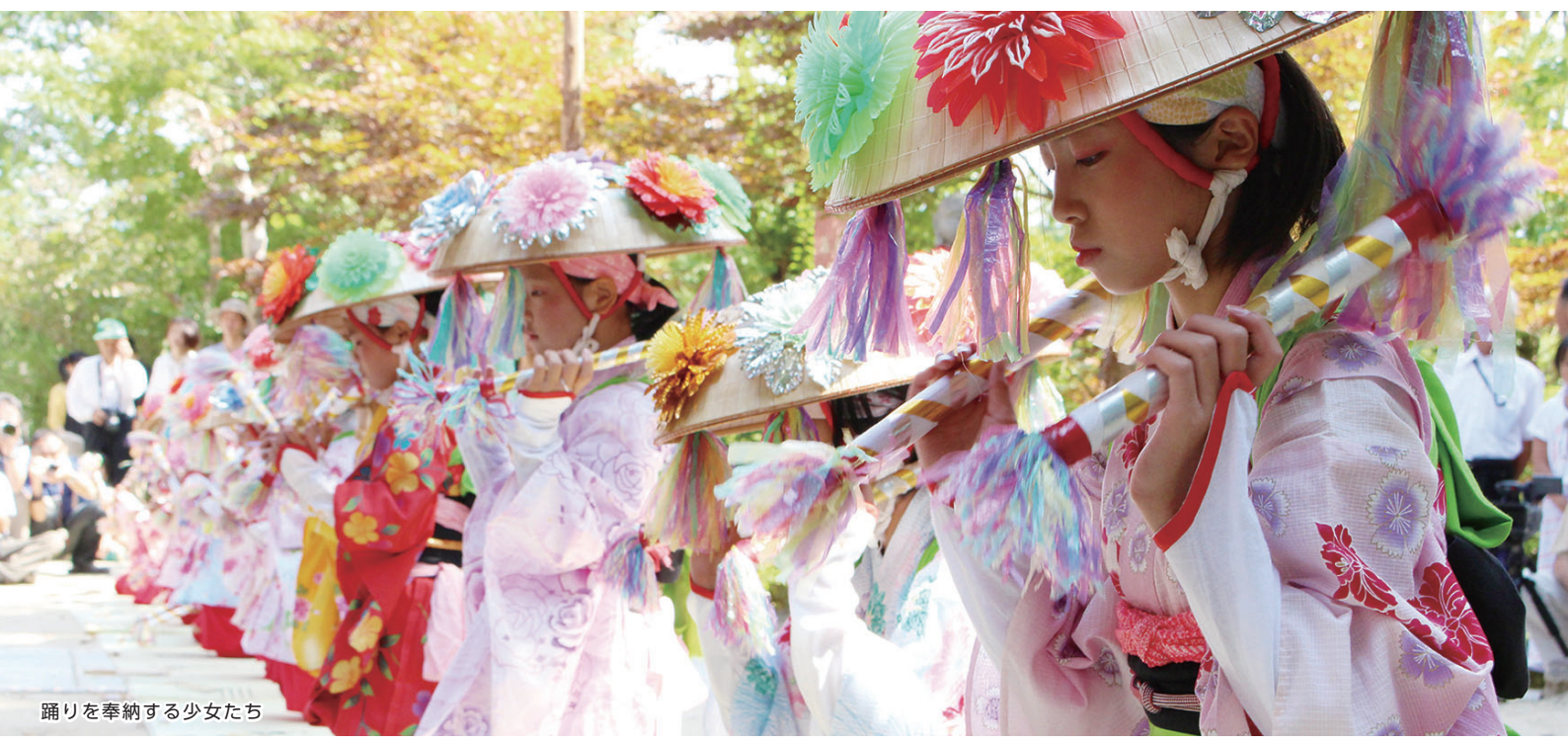
踊りを奉納する少女たち

そしてやっとうまく踊れるようになった頃、その子たちは卒業の時期を迎え、また新しい子どもたちに受け継がれ、この世代交代を繰り返しながら、念仏踊りは代々、ふるさとの財産として踊り継がれていきます。