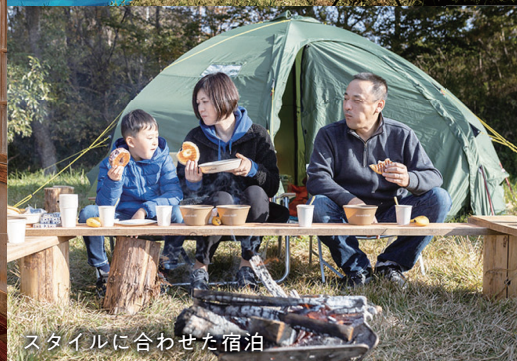
スタイルに合わせた宿泊