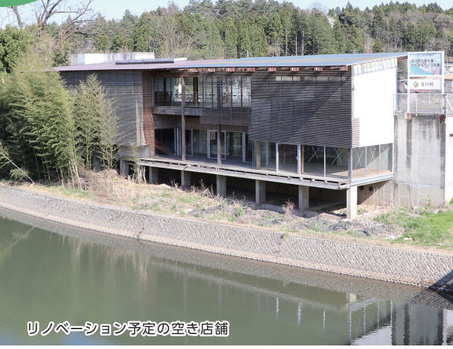
リノベーション予定の空き店舗

計画では、著名な建築家が設計を手掛けた空き店舗をリノベーションし、観光拠点として「（仮称）複合型水辺施設」を整備し、民間事業者によるオープンカフェなどの飲食施設やカーニバル体験施設、サイクリストの休憩施設、周辺観光情報の発信施設等として活用していきます。また、特産品を活用した料理フェスやマルシェ、サイクリングイベント、水辺での環境教育、写真コンテスト等のイベントも実施していきます。