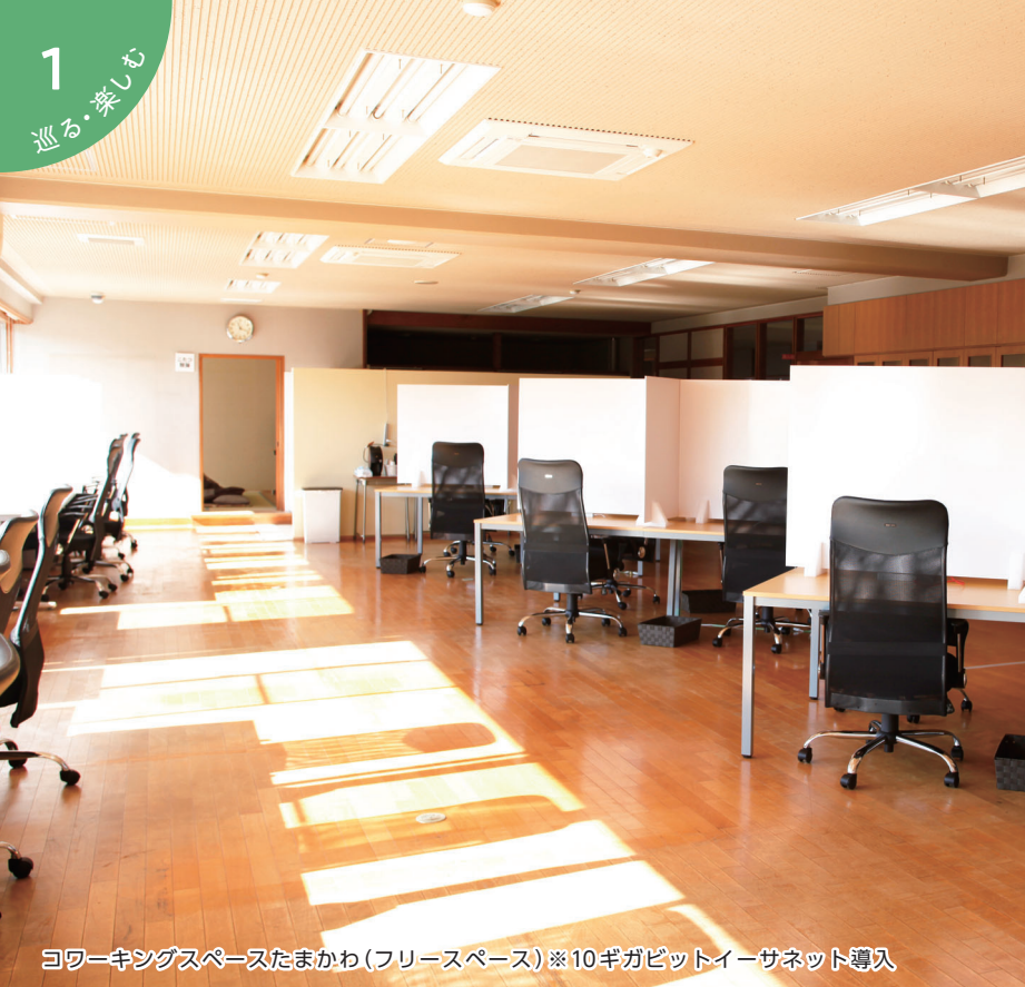
コワーキングスペースたまかわ(フリースペース) ※10ギガビットイーサネット導入