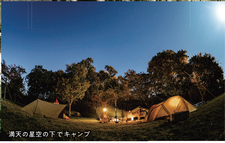
満天の星空の下でキャンプ