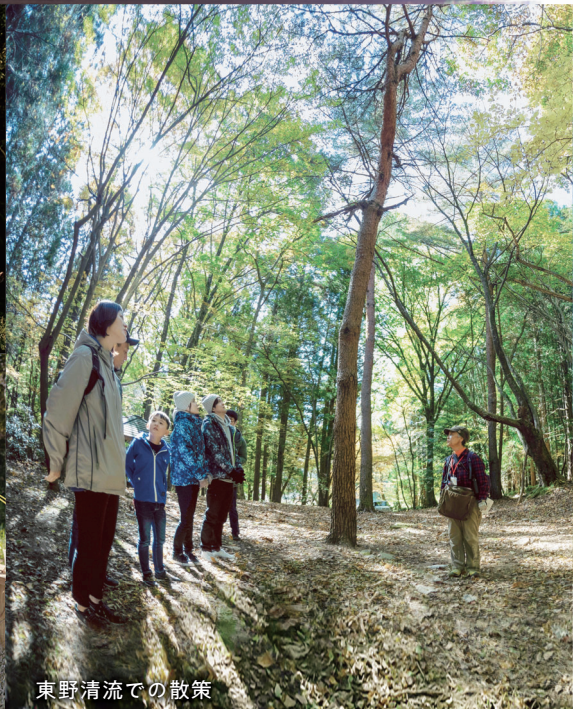
東野清流での散策