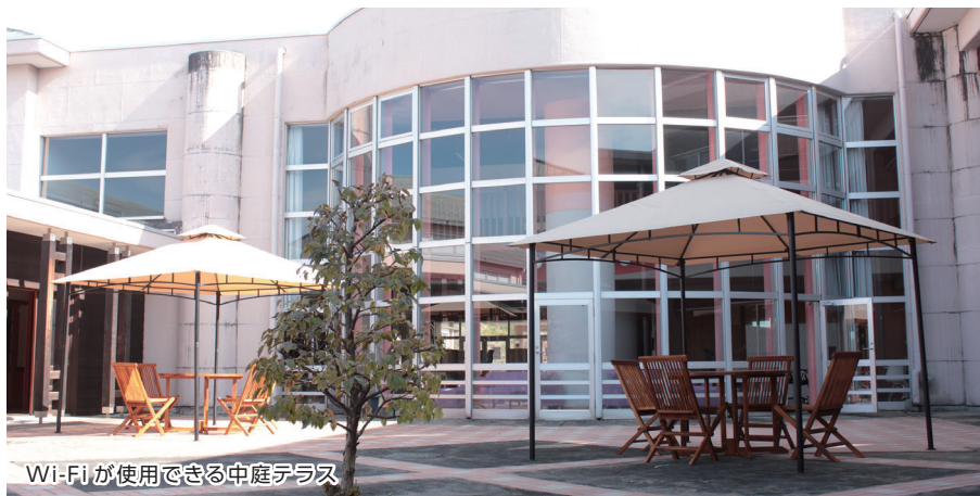
Wi-Fiが利用できる中庭テラス

また、校舎棟内に須釜支所の機能を充実させた須釜行政センターを開設しており、住民の利便性の向上にも寄与する施設となっています。