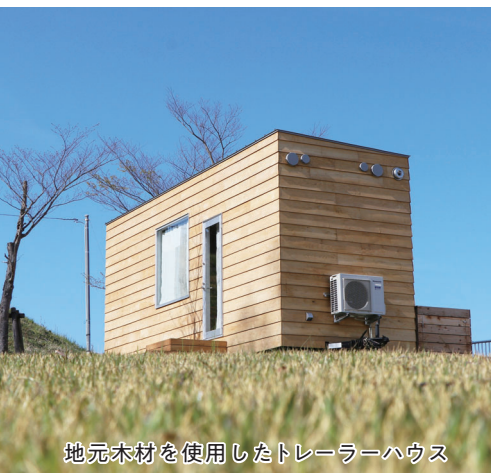
地元木材を使用したトレーラーハウス

yodgeには、宿泊室や大浴場のほか、冒険心をくすぐる屋根裏ライブラリー、屋根の上からの景色が楽しめる展望デッキ、常設のカフェもあり、来訪者の快適な空間を演出するモダンな設備が備えられています。一方で、歴史ある旧四辻分校のノスタルジックな面影を大切にし、当時の床材や柱、梁をそのまま再利用し、宿泊室の入り口には、当時の教室のガラス窓が使用されています。