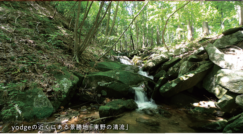
yodgeの近くにある景勝地「東野の清流」