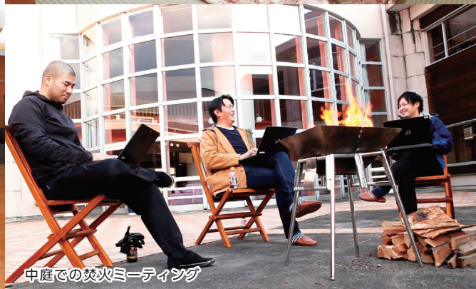
中庭での焚火ミーティング