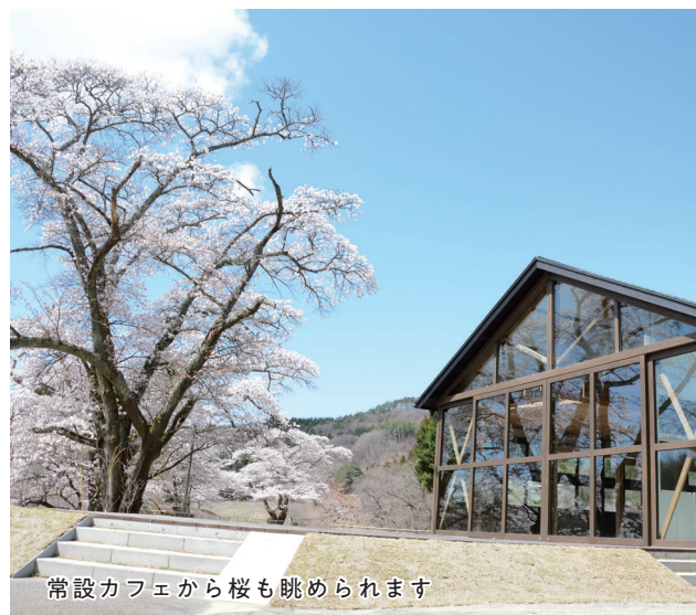
常設カフェから桜も眺められます

来訪者の皆様に、村の良さ、自然の良さ、田舎の良さを体験し、知ってもらうことにより、移住などのきっかけづくりができればと考えています。