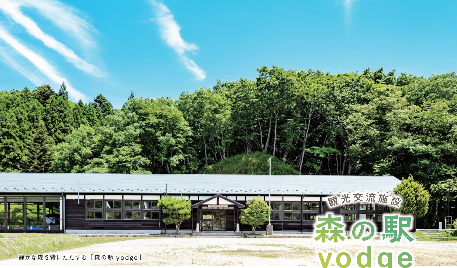
静かな森を背にたたずむ「森の駅 yodge」