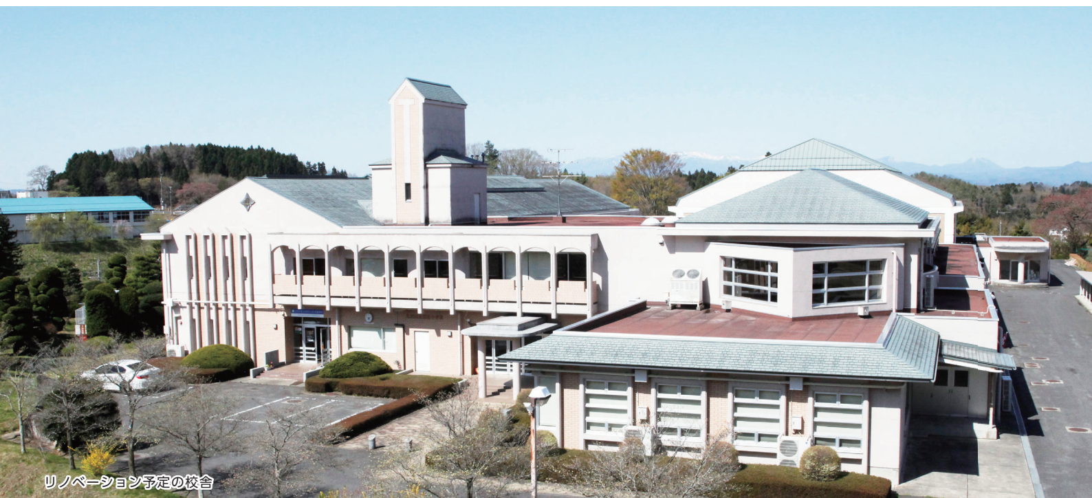
リノベーション予定の校舎